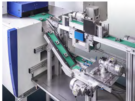
Bild Nr. 07-04 SY-Wendeeinheit.jpg Durch intelligent gestaltete Umkehrschleifen können hoch schlagempfindliche Werkstücke beidseitig entgratet werden.